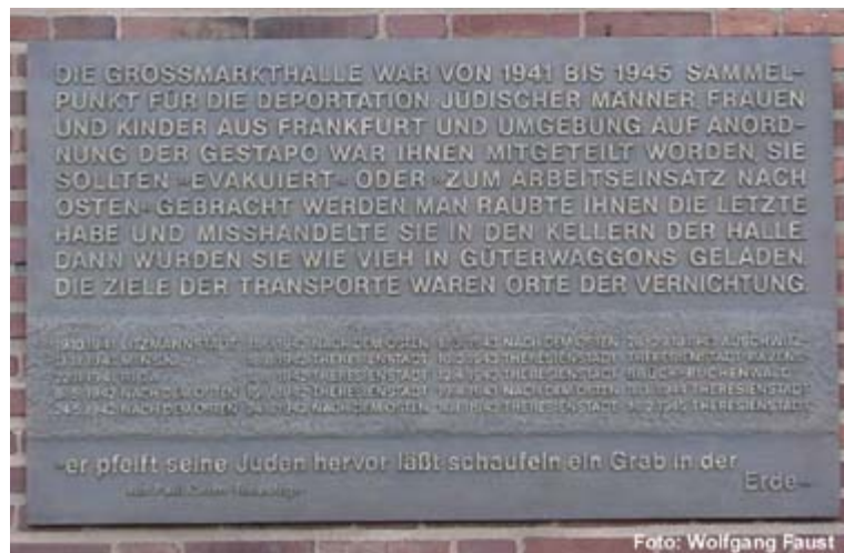
Gedenktafel an der Großmarkthalle 5