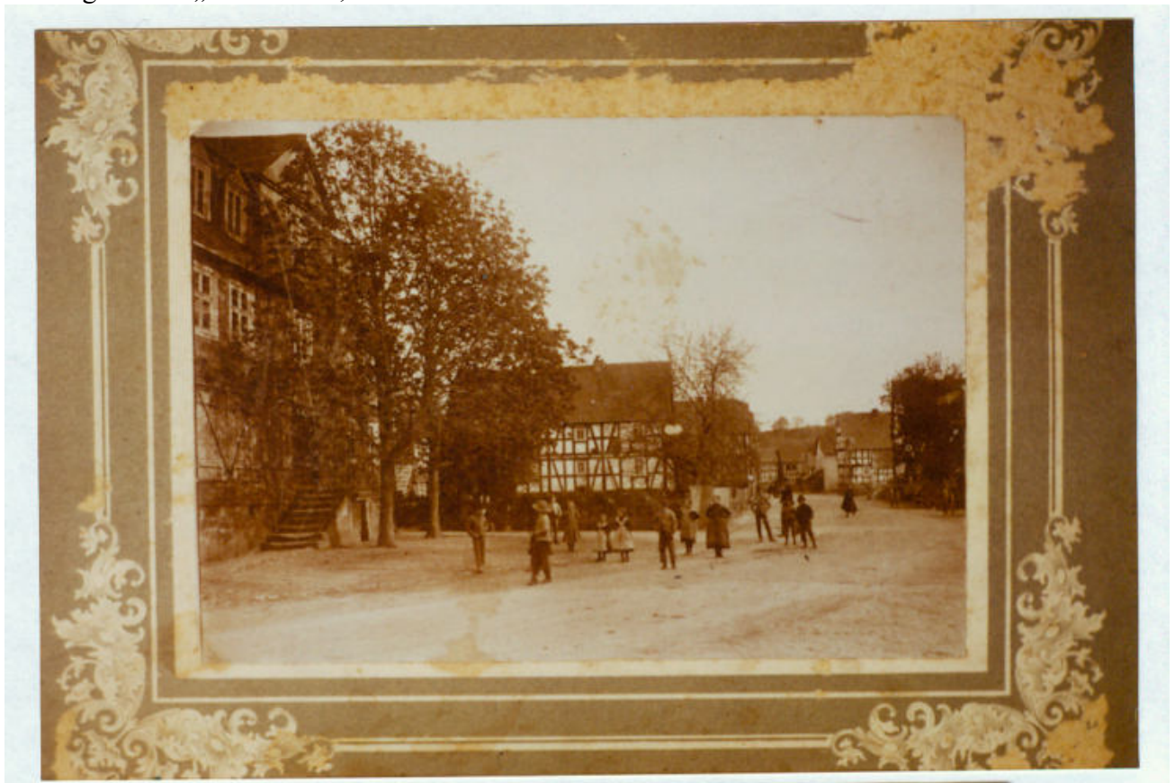
hist. Foto des Hauses Edertalstr. 44 4

Das sogenannte „Judenhaus“, Edertalstraße 44 3