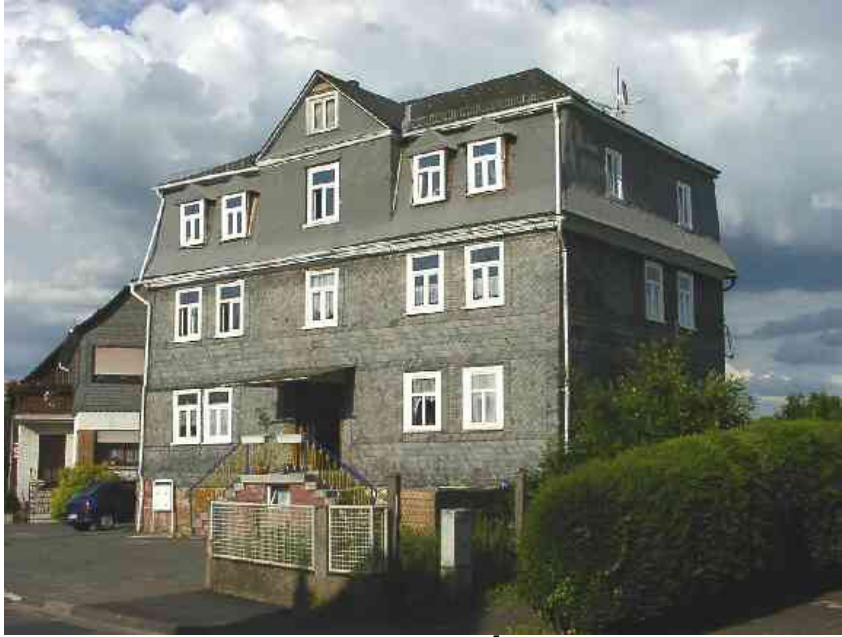
Haus der Familien Elsoffer und Lehrberge 5