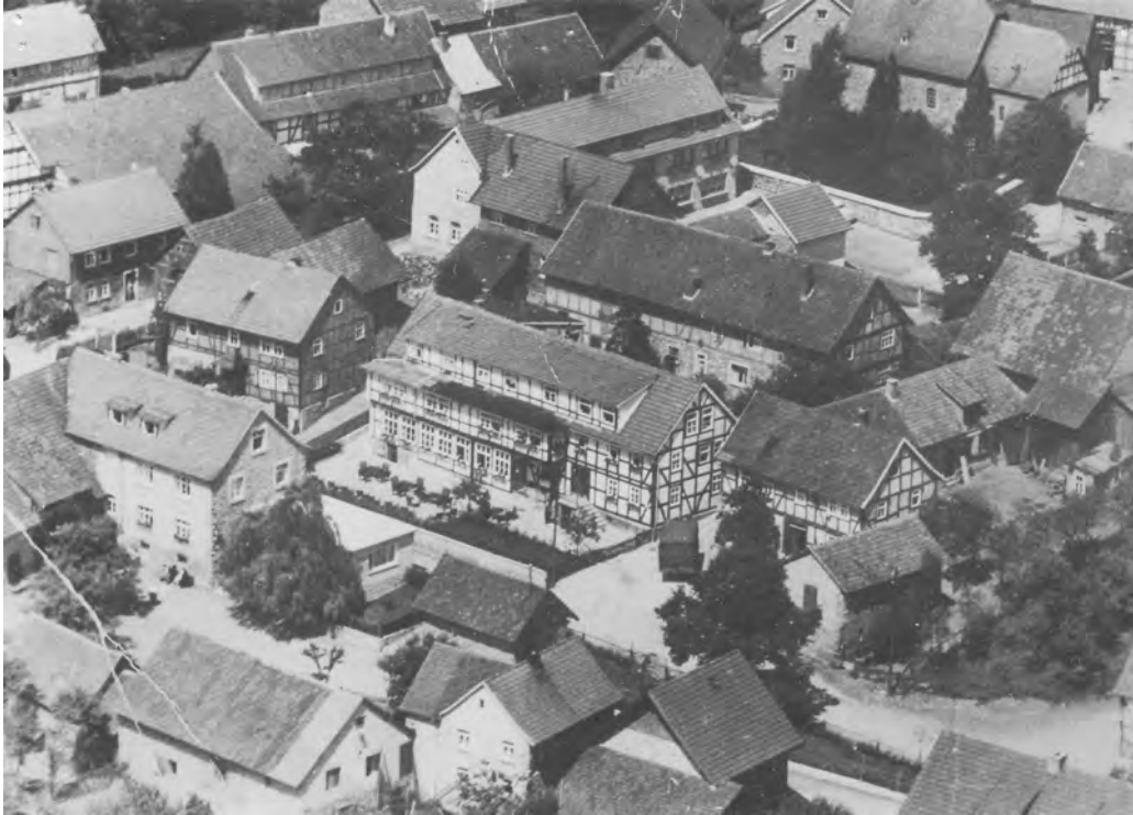
In der Mitte das große Haus der Kratzensteins 5

Selig Kratzenstein besucht die jüdische Elementarschule in Vöhl bei Lehrer Salomon Bär.